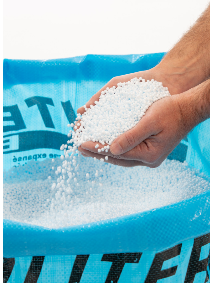
Het ECAP ® -systeem voor thermische gevelisolatie maakt gebruik