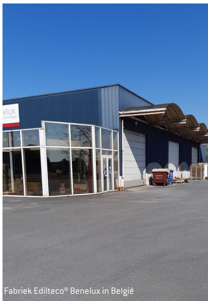
Fabriek Edilteco® Benelux in België

Edilteco Benelux® consolideert zijn omzet (2 miljoen euro) met een stijging in 2020 ten opzichte van 2019 en streeft naar een jaar 2021 dat helemaal in het teken staat van groei en ontwikkeling!