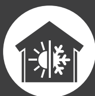
GEVEL / EPS